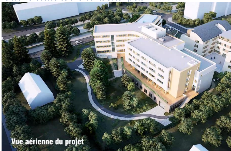
Vue aérienne du projet

Le bâtiment actuel sera réhabilité et complété :