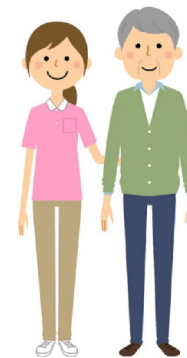
Aide et soutien des personnes malades

CENTRE D'ACCUEIL DE JOUR POUR PERSONNES SOUFFRANT DE LA MALADIE D'ALZHEIMER OU D'AFFECTIONS APPARENTÉES