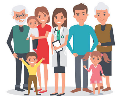
Soulagement des familles