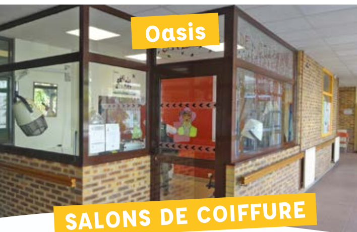
SALONS DE COIFFURE